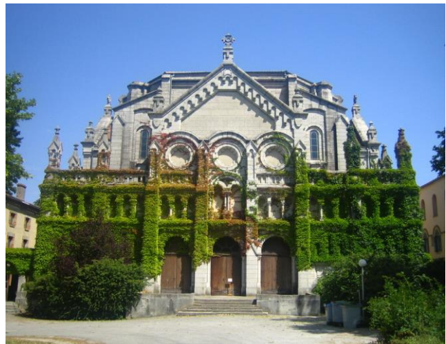
Convento de Prulla, en Francia.

Su gran entusiasmo es contagioso, Se le unen otros varones para seguirlo y con ellos llega a fundar la Orden de predicadores en un momento en que la predicación era misión de obispos.